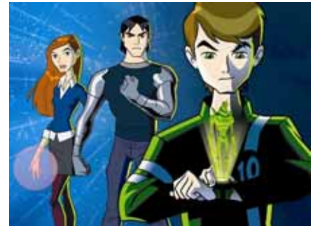
『ベン 10:エイリアン・フォース』

新作『ベン 10:エイリアン・フォース』は、前作『ベン 10』から5年後の世界を舞台にしたアクション・アドベンチャーアニメです。15歳になったベンが突然失踪した祖父マックスを探しに、再びオムニトリックスを手にし、旅立つのです。